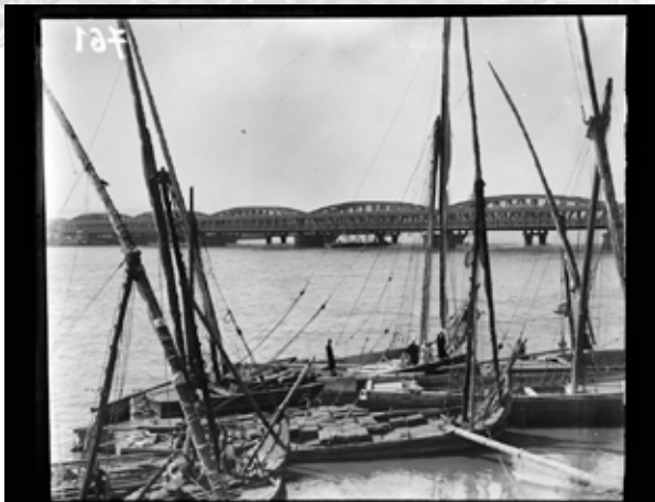
Cliché sur verre du pont d'Embehah au Caire, s.d. [1920] © Ecomusée du Bois-du-Luc

par Isabelle Sirjacobs, archiviste à l'Ecomusée du Bois-du-Luc ( archiviste@ecomuseeboisduluc.be )